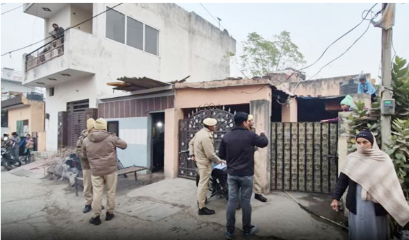
पुलिस टीम सर्च ऑपरेशन चलाती हुई।

ऑपरेशन के दौरान पुलिस ने हर घर का बारीकी से निरीक्षण किया और वहां रहने वाले सभी लोगों का डाटा इकट्ठा किया। इसमें लोगों का नाम,