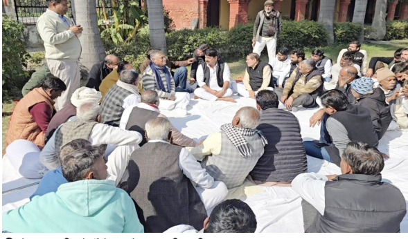
विरोध प्रदर्शन में बैठे कांग्रेस कार्यकर्ता।