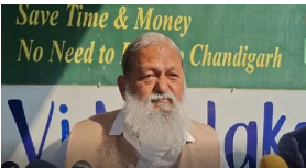
मंत्री अनिल विज।

अक्टूबर 2025 तक के आंकड़े बताते हैं कि डिफाल्टर उपभोक्ताओं में 15.98 लाख कनेक्शन अभी भी चालू हैं, जिन पर 3,873.98 करोड़ रुपये बकाया है। वहीं 6.52 लाख उपभोक्ताओं के कनेक्शन काटे जा चुके हैं, लेकिन इनके बावजूद 3,868.17 करोड़ रुपये