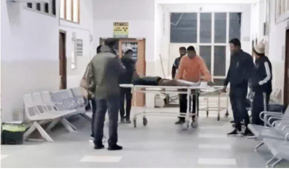
घायल बदमाश को ट्रामा सेंटर में भर्ती करवाती पुलिस।