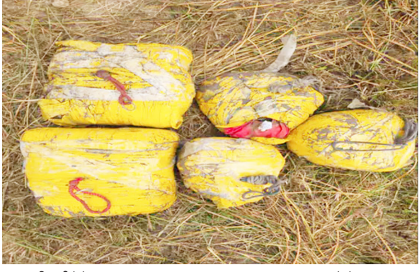
जब्त की गई हेरोइन।

अजनाला क्षेत्र के भिंडी औलख से बड़ी मात्रा में हेरोइन बरामद होने का मामला सामने आया है। गुप्त सूचना के आधार पर एंटी-नारकोटिक्स टास्क फोर्स, बॉर्डर रेंज ने सीमा सुरक्षा बल के सहयोग से एक सुनियोजित अभियान चलाया, जिसमें कुल 19.980 किलो हेरोइन को जब्त किया गया। इस कार्रवाई में चार आरोपियों को गिरफ्तार किया गया है, जिनमें मुख्य आपरेटर भी शामिल है, जो पूरे हेरोइन आपूर्ति नेटवर्क का संचालन कर रहा था। पुलिस अधिकारियों के अनुसार, प्रारंभिक जांच में पता चला है कि गिरफ्तार मुख्य आरोपी फाकिस्तान स्थित हेंडलरों से जुड़े हुए हैं। ये हेंडलर सीमा पार से हेरोइन की आपूर्ति करते थे और स्थानीय नेटवर्क के माध्यम से इसे राज्य में वितरित करावते थे। गिरफ्तार अन्य