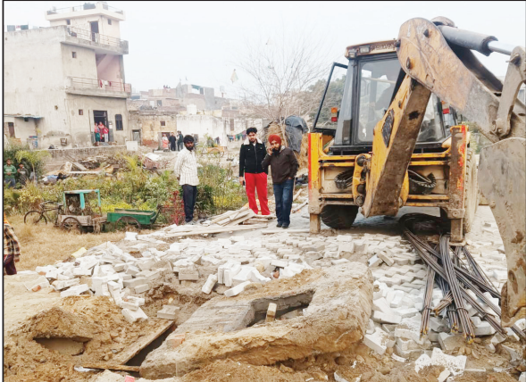
निगम की टीम अवैध कॉलोनी पर कार्रवाई करती हुई।