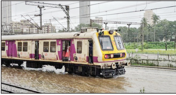
पटरी पर खड़ी ट्रेन।