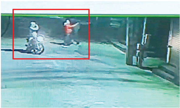
फायरिंग करते हुए आरोपी।

महानगर में अपराधियों के हौसले लगातार बढ़ते नजर आ रहे हैं। ताजा मामला फिरौती और फायरिंग से जुड़ा है, जहां बदमाशों ने एक व्यापारी से 50 लाख रुपये की फिरौती मांगी। जब व्यापारी ने फिरौती देने से इनकार कर दिया, तो बदमाशों ने देर रात उसकी दुकान पर गोलियां बरसा दीं। इस सनसनीखेज वारदात से इलाके में दहशत का माहौल है। मामले की सूचना थाना हैबोवाल की पुलिस को दी गई, जहां पुलिस ने मौके पर पहुंच सीसीटीवी कैमरों की फुटेज कब्जे में लेकर अज्ञात बदमाशों के खिलाफ मामला दर्ज किया। वहीं पुलिस ने घटनास्थल पर से 4 खोल कब्जे में