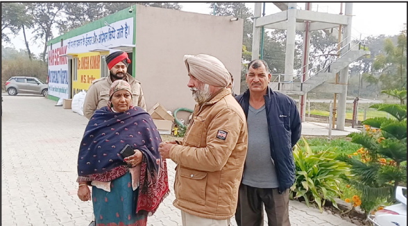
पुलिस जांच करती हुई।

जानकारी के अनुसार, देर रात एक अज्ञात वाहन गांव के पास रुक और उसमें सवार व्यक्ति ने अचानक हवा में फायर कर दिया। फायरिंग के बाद वाहन मौके से फरार हो गया। गोली चलने की आवाज सुनकर आसपास के लोग घरों से बाहर करने वालों की अन्य राजनीतिक दलों से जुड़ा बताते हुए आरोप लगाया कि कुछ लोग जानबूझकर कांग्रेस की बैठक का माहौल खराब करने पहुंचे थे।