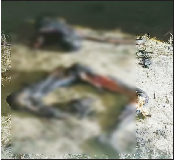
खाली प्लॉट पर पड़ी युवक की लाश।

थाना मेहरबान के अधीन पड़ते गांव ख्वाजके में सोमवार की शाम उस समय सनसनी फैल गई, जब गांव में खेतों के साथ लगते एक खाली प्लॉट में से एक युवक का जला हुआ शव पड़े होने की सूचना मिली। राहगीर ने प्लॉट में शव पड़ा देखा तो तुरंत शोर मचाया, जिसके बाद आसपास के लोग मौके पर इकट्ठा हो गए। लोगों ने जब पास जाकर देखा तो शव बुरी तरह से जला हुआ था और अलग अलग हिस्सों में पड़ा हुआ था। गांव के लोगों ने तुरंत मामले की सूचना पुलिस को दी। जहां थाना मेहरबान की पुलिस ने मौके पर पहुंच शव को कब्जे में लेकर जांच शुरू की। वहीं घटनास्थल पर देर शाम तक उच्च अधिकारियों सहित फॉरेंसिक विभाग की टीम मौजूद रही। फिलहाल शव की बुरी तरह से जलने से पहचान नहीं हो सकी है, जिसके चलते शव को 72 घंटों के लिए सिविल अस्पताल की