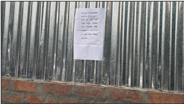
निगम द्वारा लगाया गया नोटिस।

बुझे दरिया के पास पीरू बंदा मोहल्ले में बाहर से काली तिरपाल और लोहे के टीन लगाकर काटी जा रही अवैध कॉलोनी पर मंगलवार देर शाम नगर निगम ने कार्रवाई की। यहां कई दिनों से तेजी से प्लॉट काटे जा रहे थे और अस्थायी ढांचे खड़े किए जा रहे थे। जब इसकी जानकारी सूत्रों से पता चली ‘समर एक्सप्रेस’ में प्रमुखता से खबर छपने के बाद नगर निगम हरकत में आया और मौके पर पहुंचकर कॉलोनी पर जेसीबी चली। हालांकि कार्रवाई कुछ देर बाद रोक दी गई। सूत्रों के मुताबिक कॉलोनी काटने वाले अब नगर निगम में फीस जमा करवाने की तैयारी में हैं। बड़ा सवाल यह है कि जहां फीस को रिहायशी बताकर जमा कराया जाएगा, वहीं आगे चलकर इसी जगह पर कर्मशियल फैक्ट्रियां खड़ी करने की योजना बनाई जा रही है। जबकि पूरा इलाका नगर निगम रिकॉर्ड में रिहायशी घोषित है।