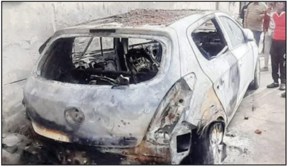
सौरव अरोड़ा | लुधियाना समर न्यूज़

मन्ना सिंह नगर स्थित एक फैक्ट्री के बाहर पार्क की गई आई-20 कार में अचानक आग लग गई। आग इतनी तेज थी कि वहां से गुजर रही हाई वोल्टेज तारों भी उसकी चपेट में आ गई। घटना की सूचना मिलते ही इलाके में अफरा-तफरी मच गई। मौके पर मौजूद लोगों ने तुरंत पुलिस कंट्रोल रूम को सूचना दी। सूचना के बाद फायर ब्रिगेड की गाड़ी मौके पर पहुंची और कर्मचारियों ने कड़ी मशक्कत के बाद आग पर काबू पाया। प्रत्यक्षदर्शियों ने बताया कि यदि समय रहते आग पर काबू न पाया जाता तो पास ही स्थित