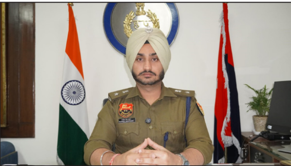
डीसीपी क्राइम जानकारी देते हुए।