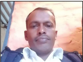
आरोपी पति