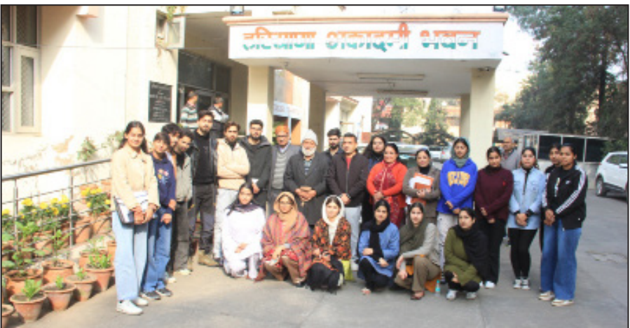
कृषि एवं किसान कल्याण विभाग।