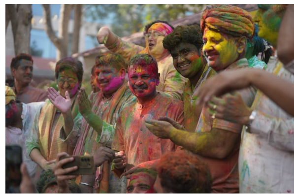
होली खेलते हुए आम आदमी पार्टी के राष्ट्रीय संयोजक अरविंद केजरीवाल।