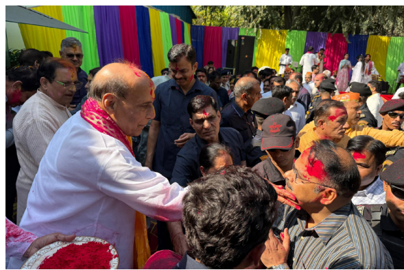
रक्षा मंत्री राजनाथ सिंह पार्टी कार्यकर्ताओं को गुलाल लगाते हुए।