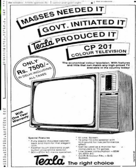
विज्ञापन की फोटो।