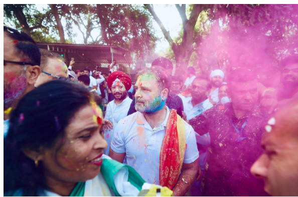
होली खेलते हुए कांग्रेस नेता राहुल गांधी।