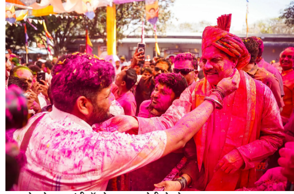
मध्यप्रदेश के मुख्यमंत्री डॉ. मोहन यादव होली खेलते हुए।