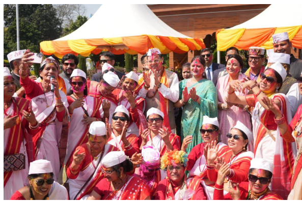
उत्तराखंड के मुख्यमंत्री पुष्कर सिंह धामी सहित अन्य लोग होली खेलते हुए।