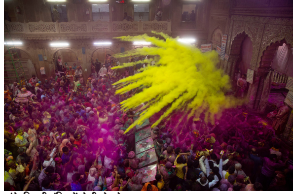
बांके बिहारी मंदिर में होली खेलते हुए श्रद्धालु।