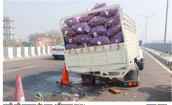
गाड़ी की टक्कर के बाद क्षतिग्रस्त हुआ।