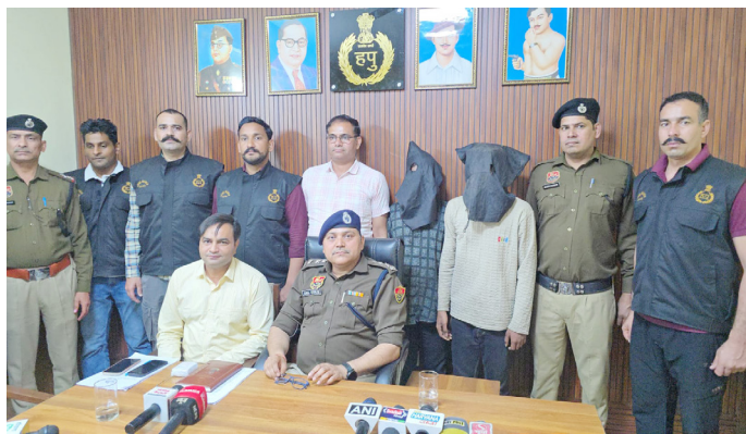
पुलिस गिरफ्तार में अपराधियों के दो साथी एवं इलाज के लिए अस्पताल में भर्ती एनकाउंटर के घायल हुए आरोपी।

पलवल सीआईए पुलिस ने मुठभेड़ के दौरान लूट के चार बदमाशों को गिरफ्तार करने में सफलता हासिल की गई है। दो आरोपियों के पैर में लगी गोली, आरोपियों से दो अवैध देशी कट्टा, दो कारतूस, चार चले हुए खोल कारतूस बरामद किए गए हैं।