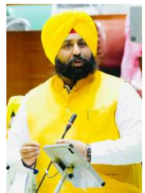
सख्त समय-सीमाएं तय की गई हैं। बेअदबी जैसे गंभीर मामलों में किसी भी प्रकार के समझौते की अनुमति नहीं होगी और बिना वारंट गिरफ्तारी का प्रावधान भी शामिल है।

पंजाब विधानसभा में भगवंत मान सरकार ने 'जगत जोत श्री गुरु ग्रंथ साहिब सत्कार (संशोधन) बिल, 2026' पेश किया, जिसमें बेअदबी के मामलों में उम्रकैद और 25 लाख रुपये तक के जुर्माने का प्रावधान किया गया है। कैबिनेट मंत्री हरजोत सिंह बैस ने इसे ऐतिहासिक कदम बताते हुए कहा कि यह कानून धार्मिक पवित्रता की रक्षा के लिए मजबूत ढांचा प्रदान करेगा।