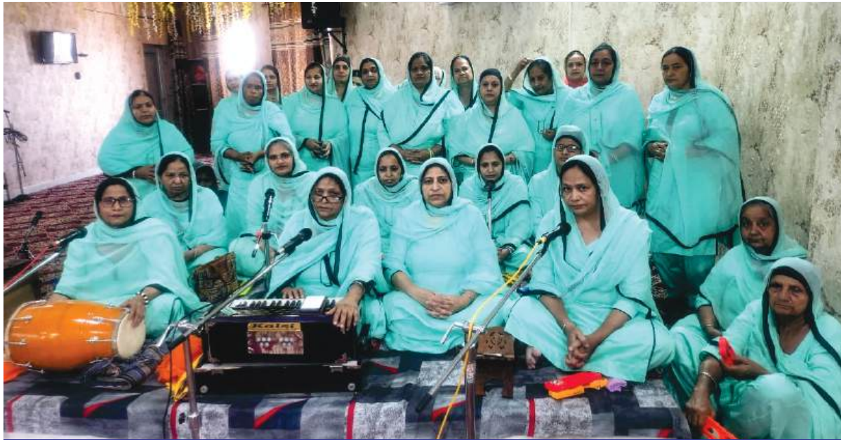
ਗੁਰਦੁਆਰਾ ਸ਼ਹੀਦ ਬਾਬਾ ਦੀਪ ਸਿੰਘ ਜੀ (ਇਸਤਰੀ ਸਤਿਸੰਗ ਸਭਾ) ਸਿਟੀ ਇਨਕਲੇਵ, ਦੁੱਗਰੀ ਪਾਂਦਰਾ ਰੋਡ, ਲੁਧਿਆਣਾ ਵਲੋਂ ਸਮੂਹ ਸੰਗਤਾਂ ਨੂੰ ਖਾਲਸਾ ਸਾਜਨਾ ਦਿਵਸ ਦੀਆਂ ਬਹੁਤ ਬਹੁਤ ਮੁਬਾਰਕਾਂ ਜੀ