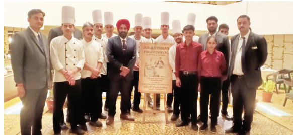
होटल वेलेवेट क्लार्क्स एक्सोटिका में एंग्लो-इंडियन फूड फेस्टिवल के बारे में जानकारी देते अधिकारी।

शहर के वेलेवेट क्लार्क्स एक्सोटिका के इल्यूजून आउटलेट में आज से 27 अप्रैल तक 11 दिनों का एंग्लो-इंडियन फूड फेस्टिवल शुरू हो गया है। यह फेस्टिवल हर रोज शाम 7 बजे से रात 11 बजे तक चलेगा, जिसमें मेहमानों को ब्रिटिश और भारतीय पकवानों के अनूठे मेल का अनुभव करवाया जा रहा है। फेस्टिवल के दौरान एंग्लो-इंडियन खाने की समृद्ध विरासत को उजागर किया जा रहा है, जो उपनिवेशिक दौर में विकसित हुई थी। मेन्यू में मुलिंगटवानी सूप, रेलवे मटन कटलेट और रेलवे वेज कटलेट जैसे पारंपरिक व्यंजन शामिल हैं, जो पुरानी रेल यात्राओं की याद ताजा करते हैं। मुख्य भोजन में नॉन-वेज बॉल करी विद येलो राइस, चिकन