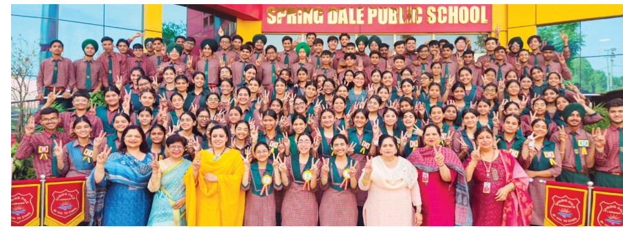
लक्की भट्टी | लुधियाना | समर न्यूज़

लुधियाना के स्प्रिंग डेल पब्लिक स्कूल में उस समय खुशी और गर्व का माहौल देखने को मिला जब विद्यालय ने सीबीएसई बोर्ड परीक्षा में कक्षा दसवीं के विद्यार्थियों के उत्कृष्ट प्रदर्शन का जश्न मनाया। इस उपलब्धि ने पूरे स्कूल परिसर को उत्सव के रंग में रंग दिया, जहां विद्यार्थियों, शिक्षकों और प्रबंधन ने मिलकर सफलता की खुशी साझा की।