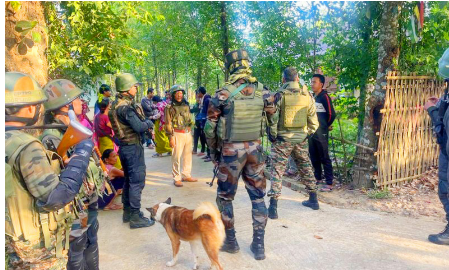
आसपास के पहाड़ी इलाकों में तलाशी अभियान और निगरानी शुरू कर दी गई।